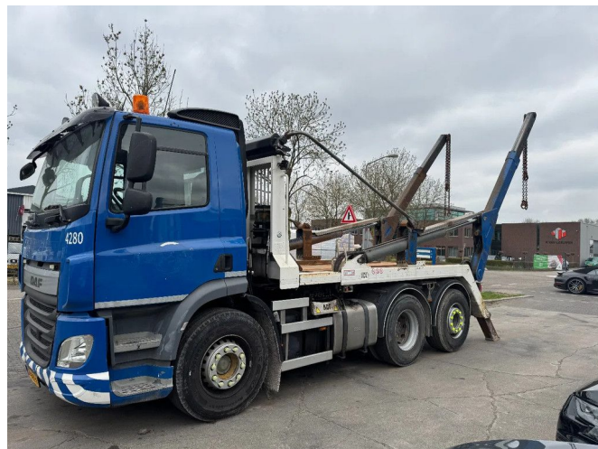
DAF CF 400 6X2 - EURO 6 + VDL P-18 + REMOTE + LIFT A...