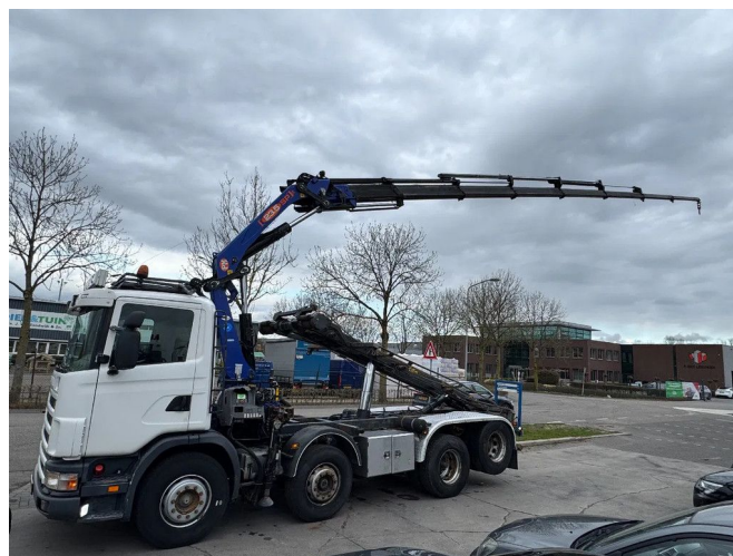
Scania R114-380 8X2 - EURO 3 + PM 23525SP LC 2013! + ...