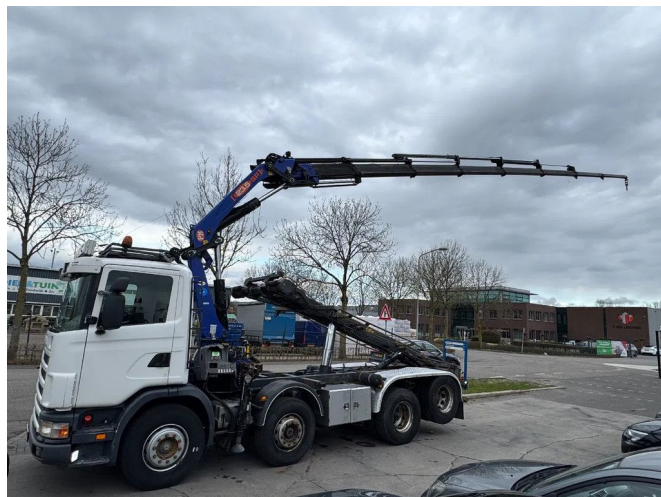
Scania R114-380 8X2 - EURO 3 + PM 23525SP LC 2013! + ...