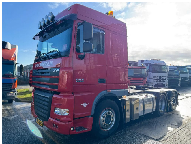
DAF XF 105.460 6X2 - EURO 5 + LIFT/STEERING AXLE