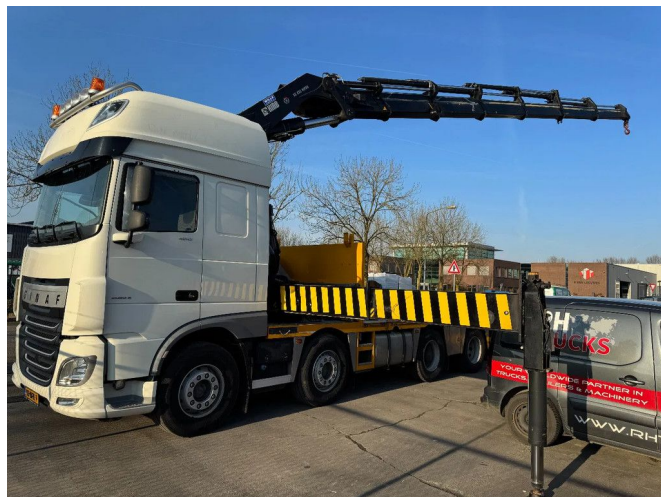
Ginaf X6 4243 CS 8X2 - EURO 6 + HIAB 855 EP-6 + REMO...