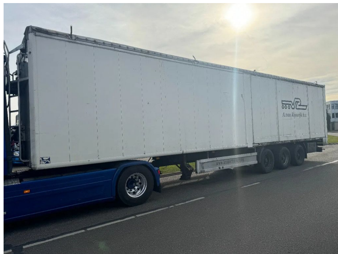
Kraker CF501 1 LIFT AXLE + REMOTE CONTROL BPW AXLES