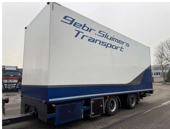
Burg M-2-18 - 2 AXLE BPW + CARRIER TRS + DHOLLANDIA... Referentienummer: BU043207