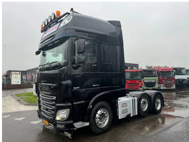
DAF XF 530 6X2 EURO 6 RETARDER HYDRAULIC TÜV TIL...