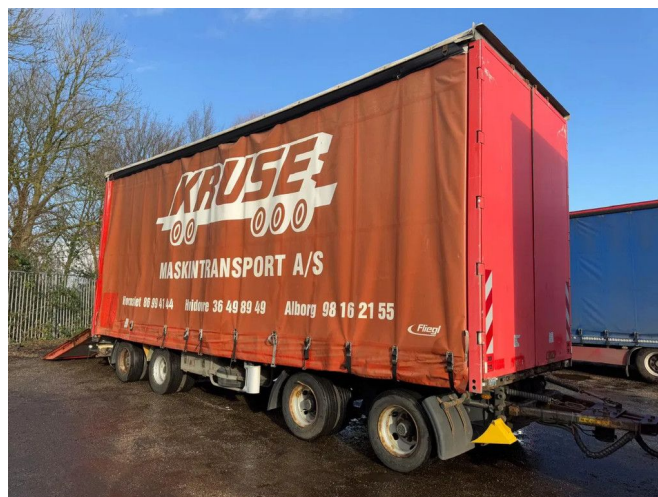
Fliegl VPS 320 HYDRAULIC RAMP 3,15 M 4X BPW AXLE U...