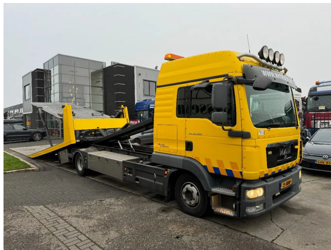
MAN TGL 12.250 4X2 EURO 5 + LIGTHART 3-LADER - MA...