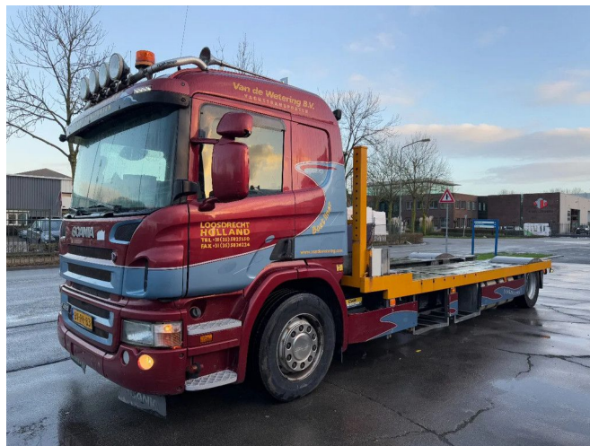
Scania P420 4X2 - EURO 5 + MANUAL GEAR + VBG VANG...