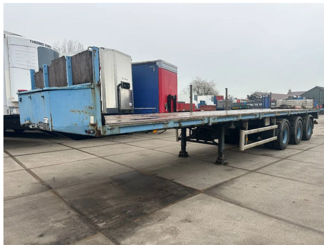
Floor LAST 2 AXLE STEERING, FIRST LIFT AXLE