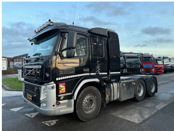
Volvo FM 500 6X4 RETARDER BIG AXLES HUB REDUCTION