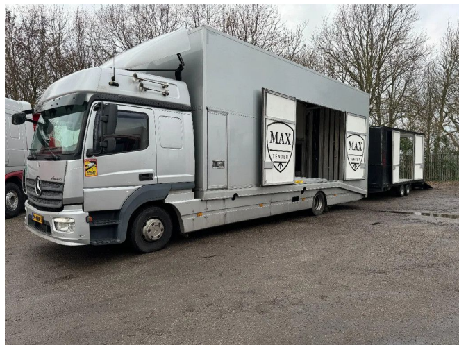
Mercedes-Benz Atego 1224 4X2 MOETEFINDT + MOETEFI...