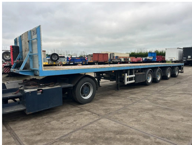
Floor 2 AXLE STEERING an 2 LIFT AXLE