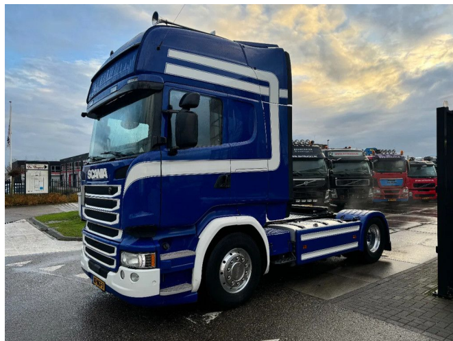
Scania R450 4X2 RETARDER SKIRTS EURO 6 TÜV TILL 04...