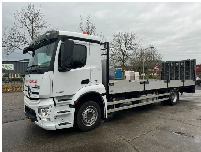
MERCEDES-BENZ 2027 4X2 DHOLLANDIA 3000 KG EURO...