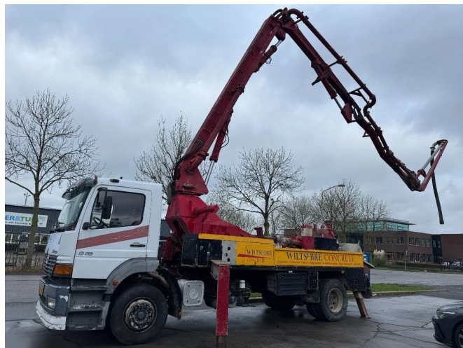
Mercedes-Benz Atego 1823 4X2 - PUTZMEISTER M24-20 R...