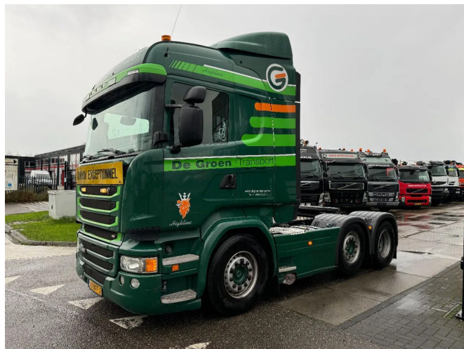
Scania R450 6X2 EURO 6 RETARDER LIFT + STEERING A... Referentienummer: SC377711