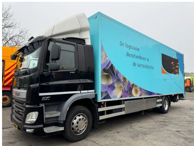
DAF CF 290 4X2 - EURO 6 + HEATING SYSTEM + BÄR CA...