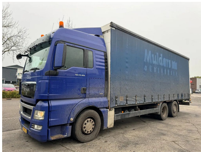
MAN TGX 26.400 6X2 - EURO 4 + LIFT + STEERING AXLE +...