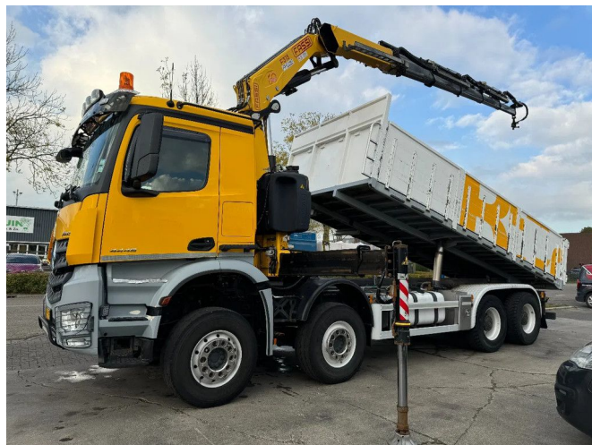
Mercedes-Benz Arocs 4448 8X4 + EURO 6 + FASSI F315 + ...