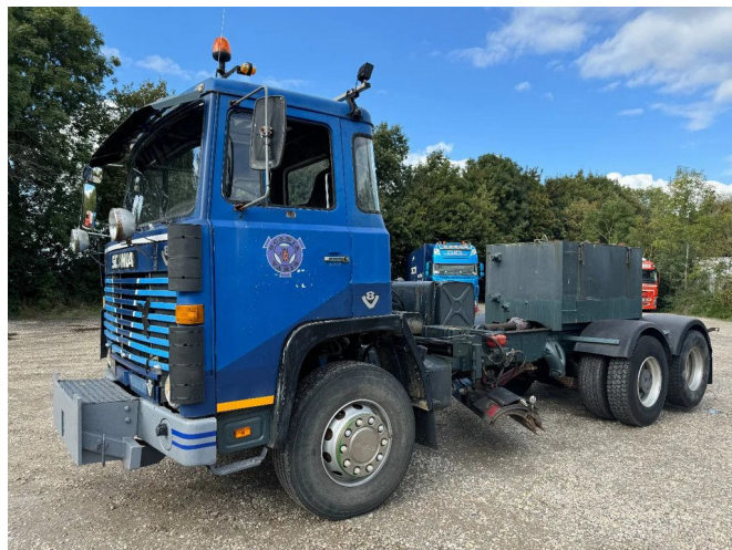
Scania LB141 V8 6X2 HUB REDUCTION - FULL STEEL SU...