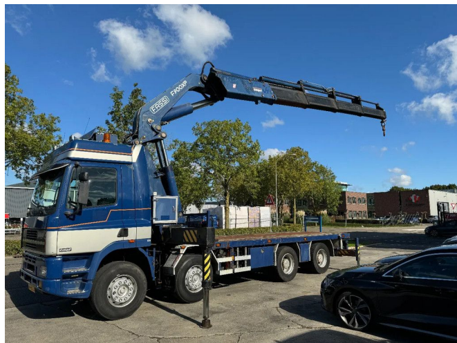
Ginaf M 4241 S EURO 2 8X4 BIG AXLES + FASSI F900 + R...