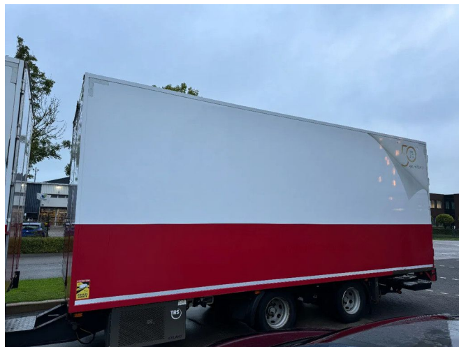
Burg M-2-18 - 2 AXLE BPW + CARRIER TRS + DHOLLANDIA... Referentienummer: BU040537