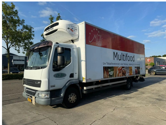
DAF LF 55.220 4X2 EEV + THERMO KING T1000R