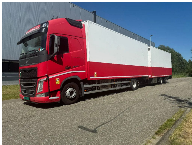
Volvo FH 460 4X2 TRS COOLING + BURG 2 AXLE HANGER