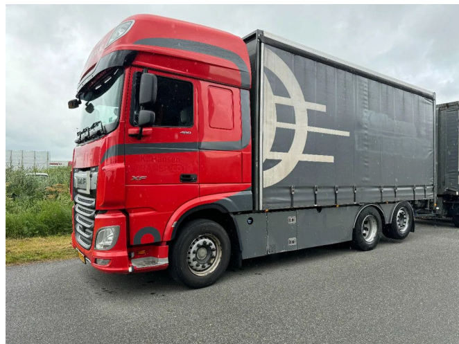
DAF XF 480 6X2 EURO 6 2018AUTOMATIC