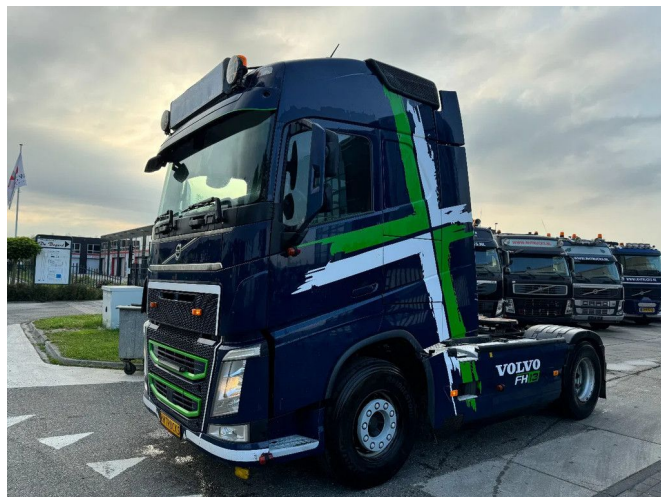
Volvo FH 460 4X2 - CHASSIS KB 2019! + KIPPER HYDRAUL...