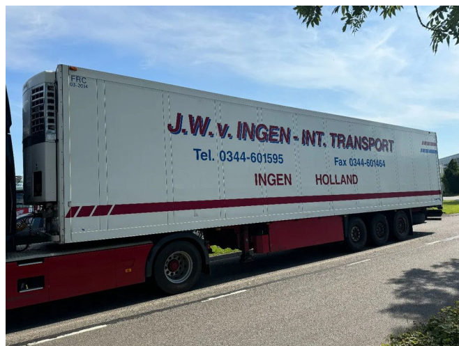
Schmitz Cargobull SKO 24 - 3 AXLE - SAF + THERMOKING ...