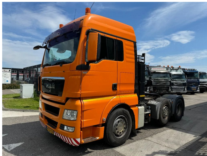
MAN TGX 26.440 6X2 - EURO 5 + STEERING AXLE