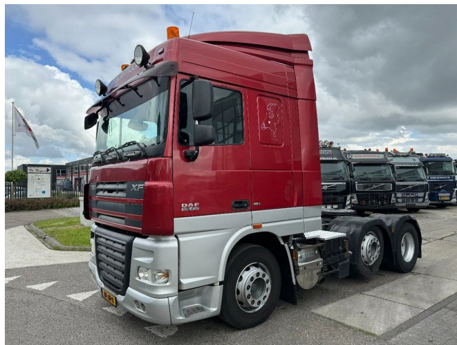
DAF XF 105.410 6X2 STEERING AXLE MANUAL EURO 5