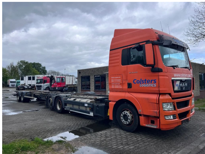
MAN TGX 26.440 XLX 6X2 + HANGER EURO 5 - BDF CHA...