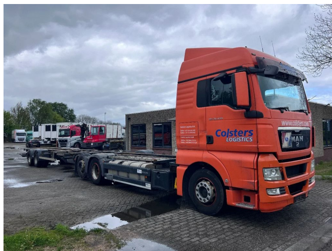
MAN TGX 26.440 XLX 6X2 + HANGER EURO 5 - BDF CHA...