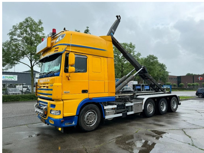
DAF XF 105.460 8X2 EURO 5 HOOKLIFT VDL 30-6500