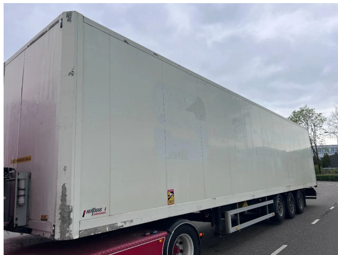
Hertoghs 3 AXLE 1ST LIFT AXLE BOX TRAILER