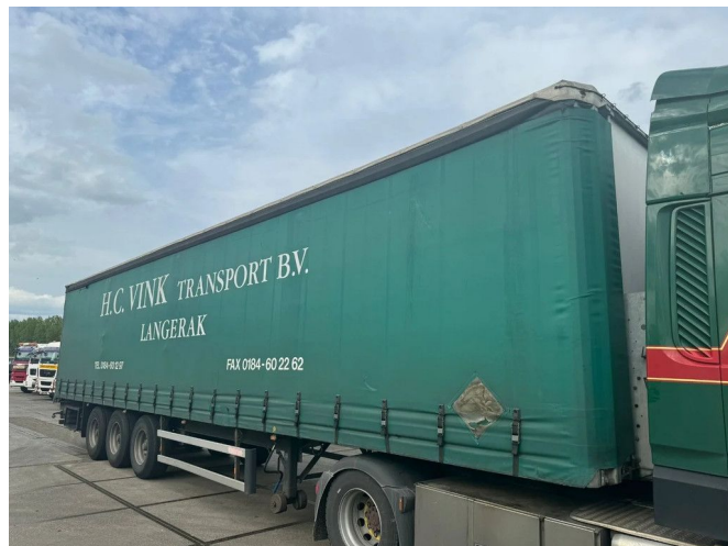
Groenewegen DRO-14-27 - 3 AXLE - BPW - DRUM BRAKES