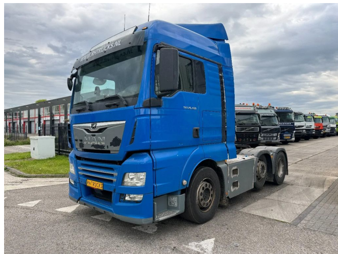
MAN TGX 26.460 XLX 6X2-2 EURO 6 LIFT AXLE