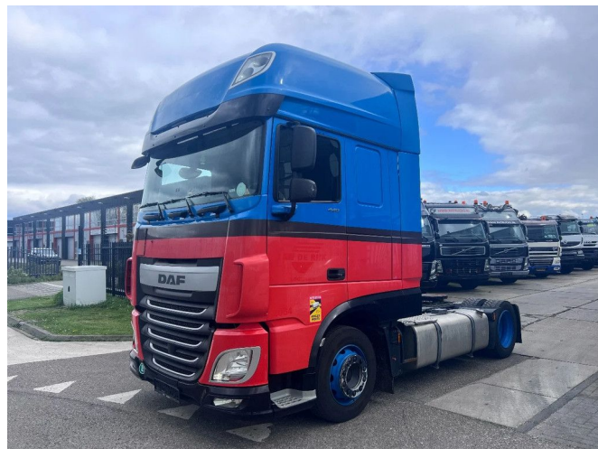
DAF XF 440 FT SSC 4X2 EURO 6