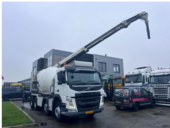
Volvo FM 410 8X4 MIXER 9m3 + LIEBHERR CONVEYOR BELT