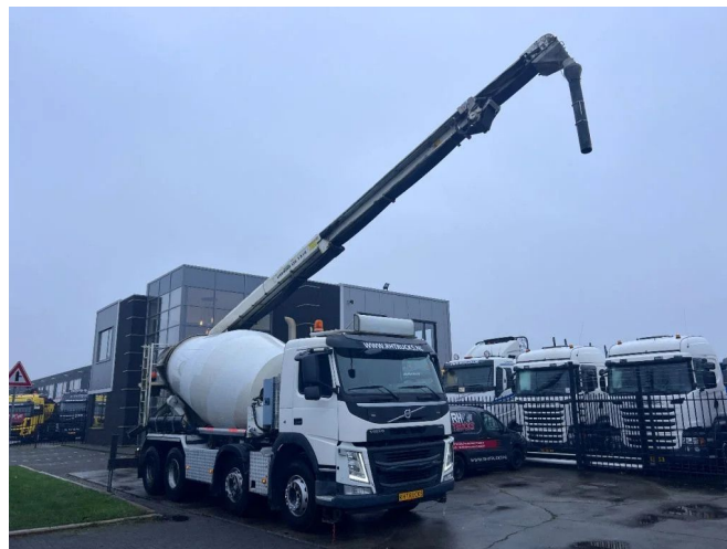
Volvo FM 410 8X4 - 3 UNITS! + MIXER 9m3 + LIEBHERR C...