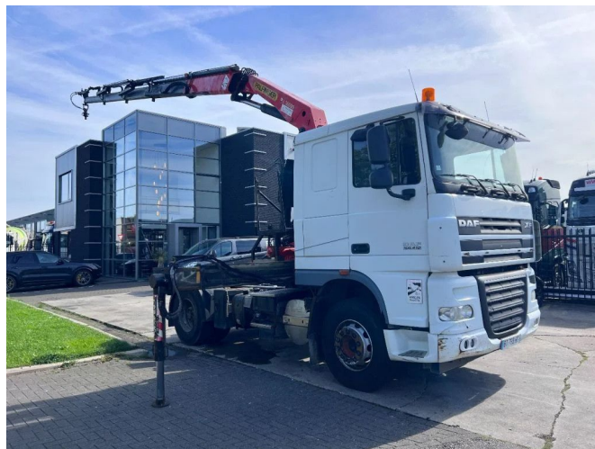
DAF XF 105.410 4X2 EURO 5 MANUAL + PALFINGER PK16...