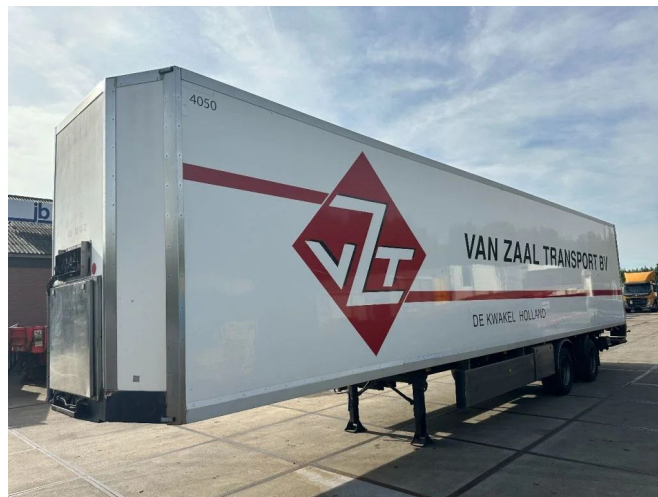
Burg LAST AXEL STEERING + LOAD LIFT