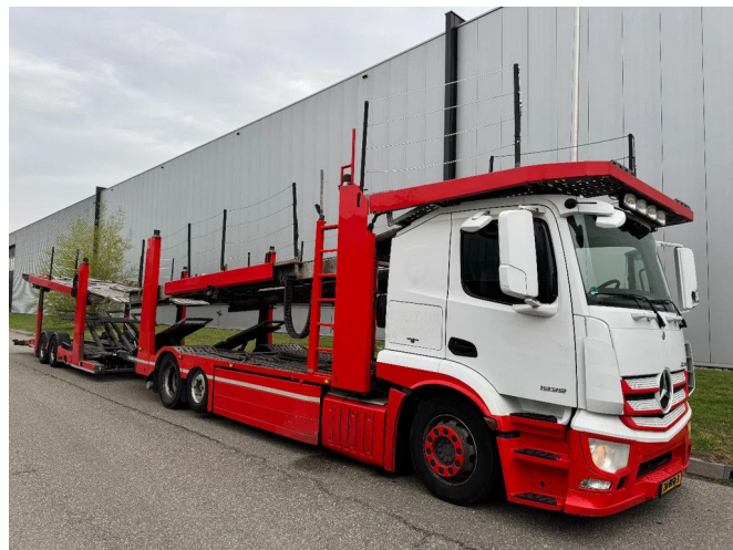
Mercedes-Benz Actros 1939 - 6X2 - EURO 6 + KAESSBOHRER...