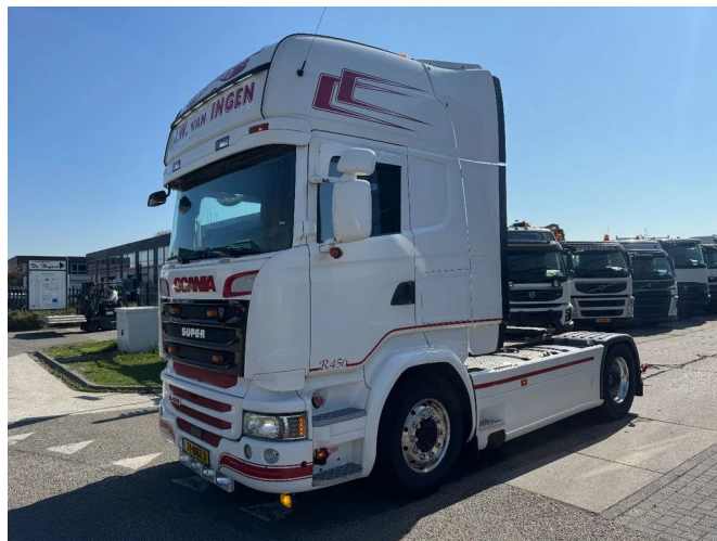
Scania R450 4X2 EURO 6 RETARDER SKIRTS TÜV TILL 01...