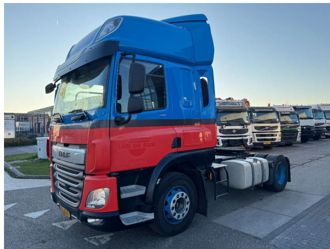
DAF CF 410 4X2 STANDARD EURO 6 FRIDGE