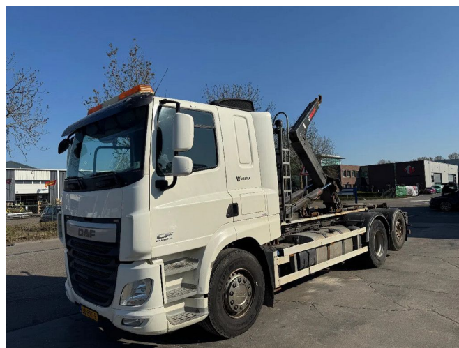
DAF CF 510 6X2 - EURO 6 + HIAB MULTILIFT + REMOTE + ...