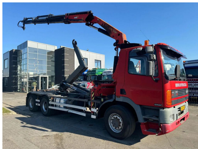
Ginaf M 3232 S 6X2 - EURO 2 + PALFINGER PK19000 + R...