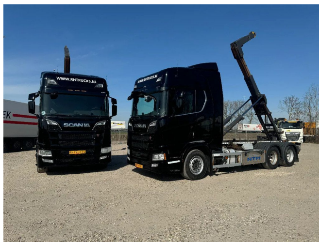
Scania R580 V8 NGS 6X2 EURO 6 VDL 20T HOOK