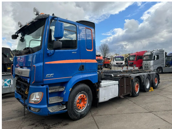
DAF CF 460 8X2 ONLY VISUAL DAMAGED // ENGINE IS R...